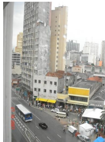
Figura 3 -Vista da área [cracolândia] a partir da janela da Pinacoteca, Rua Mauá.

Agora, além de dar “sustentação” aos equipamentos com a objetiva atração de empresas investidoras e, com elas, compartilhar o papel de “âncoras” da requalificação urbana, o percurso da cultura parece conhecer mais uma extensão com a contratação, no final de 2008, da dupla de arquitetos suíços Jacques Herzog e Pierre De Meuron para a elaboração do projeto da sede da “São Paulo Companhia de Dança” [SPCD], que será construída no centro da capital paulista, no terreno de dezenove mil metros quadrados da antiga rodoviária, localizada na Praça Júlio Prestes, ao lado da “Cracolândia”. 12 Com o novo centro cultural e teatro com capacidade para aproximadamente mil pessoas, a ideia do governo estadual [José Serra, PSDB] é uma nova tentativa de criar um polo ligado às artes na região, visto que na antiga estação Júlio Prestes, que fica em frente da antiga rodoviária, já funciona a Sala São Paulo. Tal polo, de acordo com o discurso proferido na época em que foi inaugurada a sede da OSESP, influenciaria a “revitalização” da região e agiria, já de início, “expulsando” os usuários atuais do local,