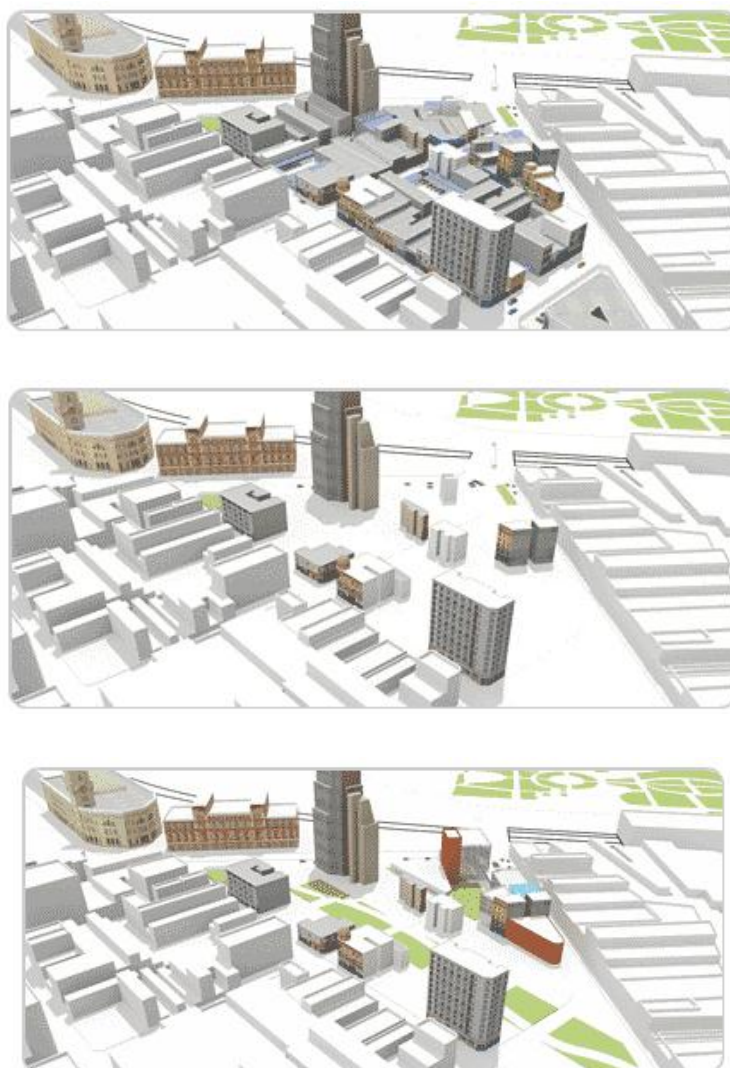
Figura 4 – Maquetes eletrônicas mostrando as transformações urbanas propostas para a área do projeto de requalificação Nova Luz, com a implantação dos edifícios públicos.

onde até o momento do pronunciamento funciona um shopping popular especializado em tecidos, que será desapropriado.