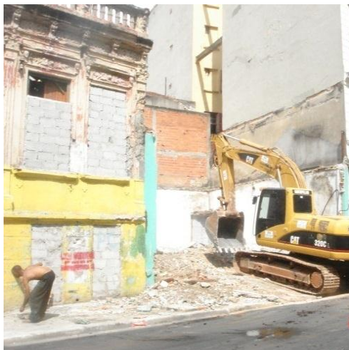
Figura 1 – Início da demolição dos edifícios da “Cracolândia”, em 27/10/2007. Antiga loja número 381, Rua General de Couto Magalhães.