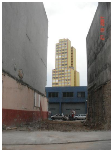
Figura 2 – Vista de terreno vazio após demolição.